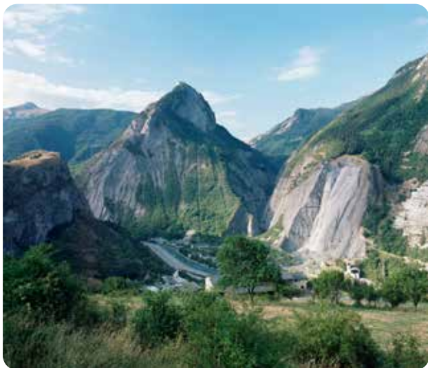
Le site de Calypso

La Houille Blanche fait référence à l'énergie hydroélectrique, qui a alimenté toute l'industrie de la vallée de la Maurienne. Au tournant des années 1890, la territoire réunit deux atouts décisifs : le réseau torrentiel de l'Arc, propice à l'aménagement de chutes, et une desserte ferroviaire précoce sur l'axe international du Fréjus (Modane-Saint-Jean-de-Maurienne-Chambéry), idéale pour acheminer matières premières